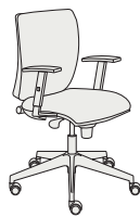
179261 h1005 . d680 . w680