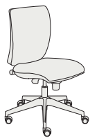
179211 h1005 . d680 . w680

Sprint steht für Schnelligkeit, Zweckmäßigkeit und leichte Handhabung. Ein echtes Spitzenmodell, das sich dank seiner Benutzerfreundlichkeit seit Jahren großer Beliebtheit erfreut. Ein Stuhl, der lässig durch den Tag begleitet und das Zurechtfinden im Arbeitsplatzdschungel erleichtert.