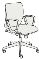
179281 h1030 . d680 . w680