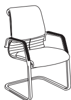
2880 h920 . d670 . w595