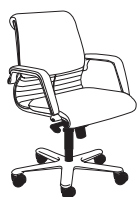
2842 h1000 . d670 . w640