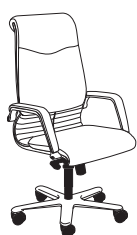
2812 h1220 . d700 . w700

Die Armlehne ist ein Element, das Klasse und Eleganz ausstrahlt und den Kontrast von Verchromungen und weichem Bezug hervorhebt. Die im oberen Bereich gewellte Rückenlehne beschreibt perfekt die Seele dieses Stuhls. Eleganz für den Arbeitsplatz und das gewisse Etwas für den Raum.