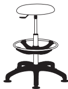
08369 h860 . d630 . w630