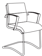
70450 h880 . d640 . w590