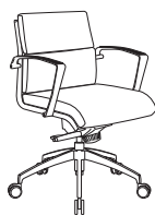
70420 h1035 . d680 . w680