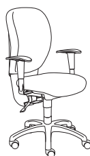
09605 h1020 . d630 . w630