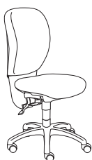
0960 h1020 . d630 . w630

Ein fröhliches, gleichzeitig aber robustes Sitzmöbel. Seine originelle Form wird beibehalten und es überrascht durch seine unglaubliche Benutzerfreundlichkeit sowie einfache und aktuelle Linienführung. Wir stellen Ihnen Gummy vor: bunt, schlicht, schön. Entworfen, um Spaß zu machen.