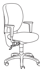
09607 h1020 . d630 . w630