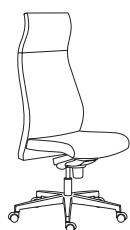
80010 h1280 . d660 . w660

Die Rückenlehne ist seine Stärke. Dank seiner geschwungenen Linie passt sich Energy den Körperformen perfekt an und bietet einen unbezahlbaren Komfort. Die ansprechende Form der fixen Armlehne bildet eine Einheit mit der Schale. Das Ergebnis ist der perfekte Stuhl für ein dynamisches und extravagantes Ambiente.