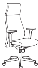
80012 h1280 . d660 . w660