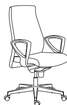
80021 h1060 . d660 . w660